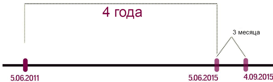
Данные расчеты были разработаны по аналогии с парламентскими выборами

при условии его последующего признания. В данном случае точкой отсчета времени является дата предыдущих выборов. Исходя из того, что датой предыдущих всеобщих местных выборов было 5 июня 2011 года, возьмем соответствующую дату за точку отсчета для первого сценария. Согласно первому сценарию всеобщие местные выборы должны быть организованы в интервале 5 июня - 4 сентября 2015 года, данный сценарий поддерживается юристами Promo-LEX и подтверждается историей проведения предыдущих всеобщих местных выборов.