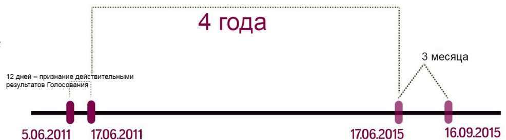
Данные расчеты были разработаны по аналогии с парламентскими выборами