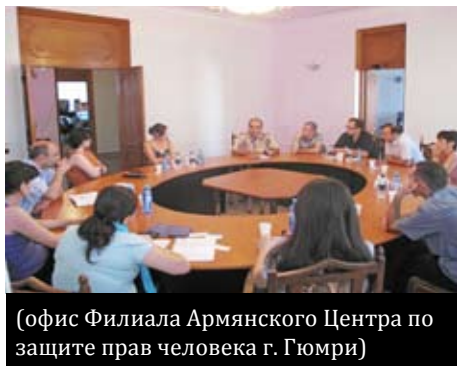
(офис Филиала Армянского Центра по защите прав человека г. Гюмри)

В ходе встречи приняли участие представители следующих организаций: Филиал Армянского Центра по защите прав человека, г. Гюмри; Интеллектуальный Центр „ХоранАрд“; Социально-образовательный Центр Ширакской епархии Армянской Апостольской Церкви; Орхус-центр г. Гюмри; НПО «Биософия»; НПО «Ширак центр»; НПО «Менк Плюс».