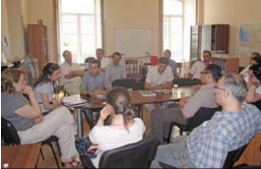
(офис Организации «Международная тюремная реформа», Тбилиси, Грузия)

Деятельность организации направлена на реформу системы уголовного правосудия в Грузии, Армении и Азербайджане. В ходе встречи члены организации сообщили о своем сотрудничестве с гражданским обществом в этой области, в том числе о достигнутом прогрессе и трудностях, с которыми они сталкиваются.