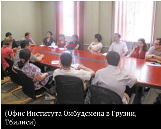
(Офис Института Омбудсмена в Грузии, Тбилиси)