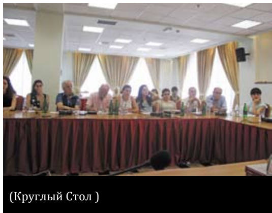
(Круглый Стол )

В ходе Круглого Стола участники обсудили дела, рассмотренные ЕСПЧ и влияние решений на национальное законодательство. По этому вопросу, участники из Армении отметили, что в делах со стороны Армении в значительной степени акцент ставится на решении конкретного дела, а не на решение проблемы в целом. Они также отметили, что все больше и больше адвокатов и правозащитных НПО просят Суд высказаться по вопросу законодательства. Участники из Молдовы и Грузии