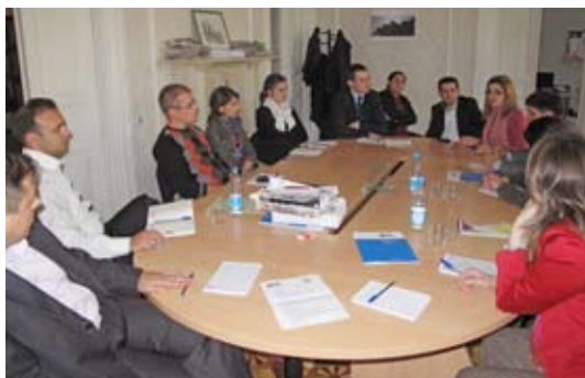
(офис Организации «Институт Прав Медиа», Баку, Азербайджан)

С более подробной информацией о деятельности организации можно ознакомиться на сайте: http://www.mediarights.az/