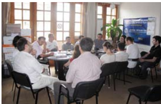
(офис Центра по Правам Человека, Тбилиси, Грузия)