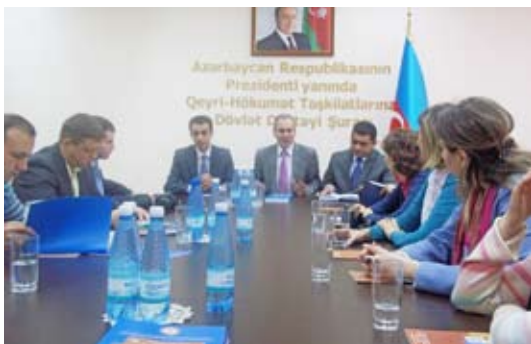
(офис Совета государственной поддержки НПО, Баку, Азербайджан)

В ходе визита представители этого учреждения рассказали о своей деятельности, и каким образом учреждение поддерживает местные НПО. Учреждение находится под патронатом Президента Азербайджана.