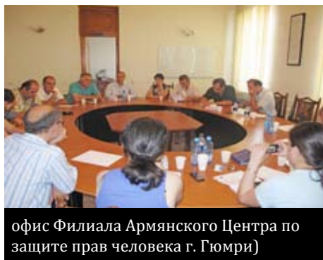
офис Филиала Армянского Центра по защите прав человека г. Гюмри)

В ходе встречи участники обсудили ситуацию в области прав человека в Армении. Участники из Армении рассказали о проблемах, с которыми сталкиваются местные организации в контексте ограничения со стороны государства право на свободу слова, собраний и объединений, а также многочисленных случаях нападения на членов НПО.