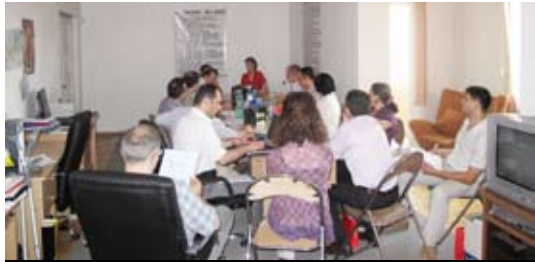
(офис Союза 42-й статьи Конституции, Тбилиси, Грузия)

В ходе встречи участники представили организации, которые они представляют, и рассказали об их деятельности в области прав человека. Они обсудили наиболее показательные и стратегические дела, которые представляют в ЕСПЧ, стратегии решения проблем, с которыми сталкиваются в своей работе, проблемы, существующие в странах Восточного Партнерства, а также как эти проблемы влияют на развитие демократии. Также, обсудили план действий в рамках проекта. Более подробную информацию о деятельности организации можно получить на сайте: http://www.article42.ge/index.php?lang=eng