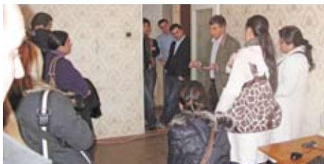
(офис НПО „Новая Газета”)

Участники посетили офис НПО “Новая Газета” и ознакомились с работой данной организации и изданием, поднимающим вопросы прав человека в регионе. Члены организации рассказали, каким образом издается газета и видеорепортажи с новостного портала НПО региона – www.dniestr.tv . Также, участники узнали о ситуации прав человека в регионе и имели возможность задать вопросы членам организации.