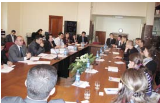
(офис Института Омбудсмена в Азербайджане, Баку)

В ходе встречи Омбудсмен вкратце рассказал об Институте и основной работе. Также, Омбудсмен рассказал о том, как учреждение сотрудничает с неправительственными организациями Азербайджана, и результатах, достигнутых вследствие этого сотрудничества.