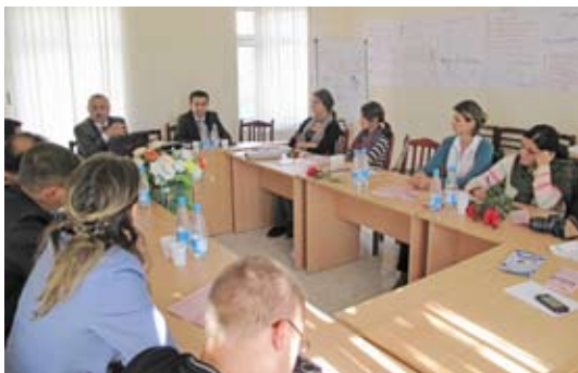
(офис Организации “Потенциал” Союз специалистов Сумгаита, Сумгаит, Азербайджан)

В ходе встречи обсуждался опыт организации в том, что касается защиты прав человека посредством оказания правовых услуг и выделения правовой информации. Организация также стремится содействовать развитию гражданского общества в Азербайджане путем продвижения демократических принципов. Для этого организация находит и работает со специалистами из различных областей, которых впоследствии продвигает в политическую жизнь.