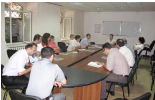
(офис Ассоциации Молодых Юристов Грузии, Тбилиси, Грузия)

Для более подробной информации о деятельности АМЮГ, посетите: http://gyla.ge/index.php?lang=en