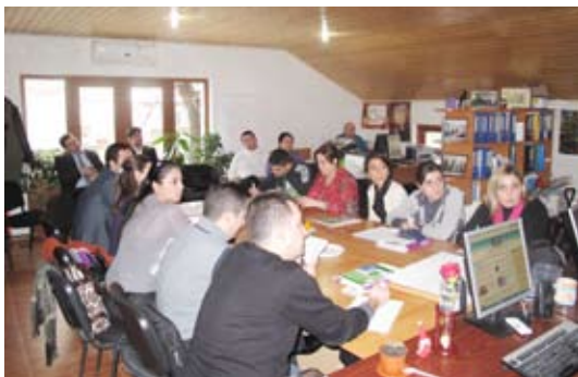
(офис Института Уголовных Реформ, Кишинев, Молдова)

В ходе визита представители ИУР рассказали о работе организации с точки зрения уголовной реформы и практики медиации в Республике Молдова. Были представлены результаты в этой области. Принимающая организация рассказала о том, как сотрудничать с государственными органами и другими организациями для достижения целей адвокаты. Участники проявили большой интерес к практике медиации. По этой теме было задано много вопросов.