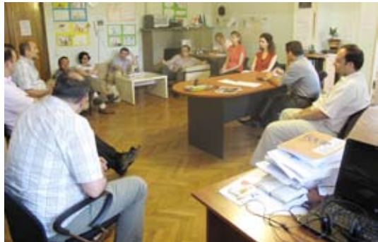
(офис Грузинского Центра психологической и медицинской реабилитации жертв пыток, Тбилиси, Грузия)

С более подробной информацией о деятельности организации можно ознакомиться на сайте: http://humanrightshouse.org/