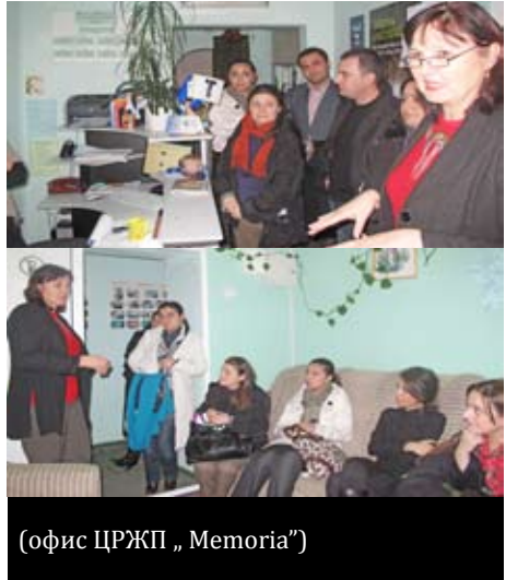
(офис ЦРЖП „Memoria”)

Для более подробной информации о работе организации, посетите: www.memoria.md