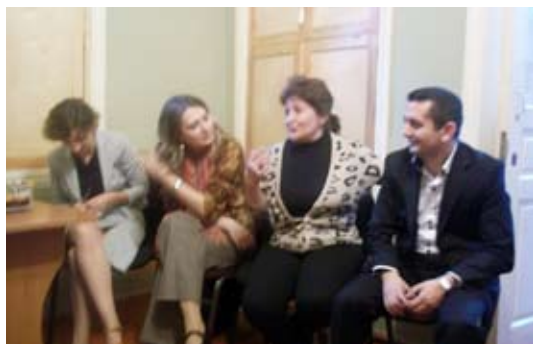
(офис Общественного объединения по оказанию помощи женщинам «Чистый мир», Баку,)

Организация оказывает правовую и психологическую помощь жертвам насилия в семье, а также жертвам торговли людьми и лицам, употребляющим наркотики, сексуальным меньшинствам.