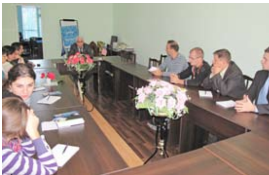
офис Правового ресурсного центра верховенства закона, Сумгаит, Азербайджан)

В целях облегчения доступа к правосудию в сельской местности, офис ОБСЕ в Азербайджане создал региональные центры, которые предоставляют бесплатные юридические услуги гражданам по делам о нарушении прав человека. В ходе визита участники встретились с членами центра в Сумгаите, которые рассказали о его работе, о проблемах, с которыми обращаются граждане, а также о препятствиях, которые чинят власти правозащитникам в Азербайджане. Кроме того, Центры оказывают помощь специалистам в области прав человека в рамках учебных тренингов.