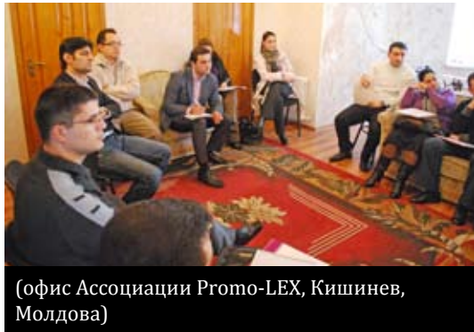
(офис Ассоциации Promo-LEX, Кишинев, Молдова)

В ходе визита участники обсудили инициативы адвокаты в области прав человека в Молдове. Члены Ассоциации Promo-LEX рассказали о деятельности этой организации в данной части и о стратегиях адвокаты на последующие годы.