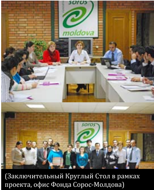
(Заключительный Круглый Стол в рамках проекта, офис Фонда Сорос-Молдова)

Визит закончился брифингом, организованным в офисе Фонда Сорос-Молдова, в ходе которого участники оценили результаты этого проекта и обсудили новые идеи для будущего сотрудничества и партнерства в целях продвижения и защиты прав человека в странах Восточного Партнерства.