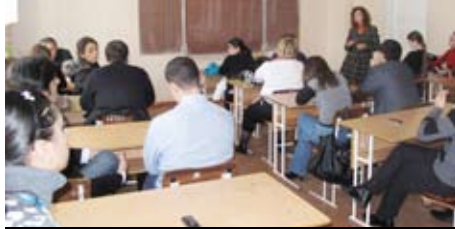
(Лицей „Лучиан Блага”, Тирасполь)

Дубоссары и Тирасполя, который рассказали о своей работе и трудностях, с которыми они сталкиваются.