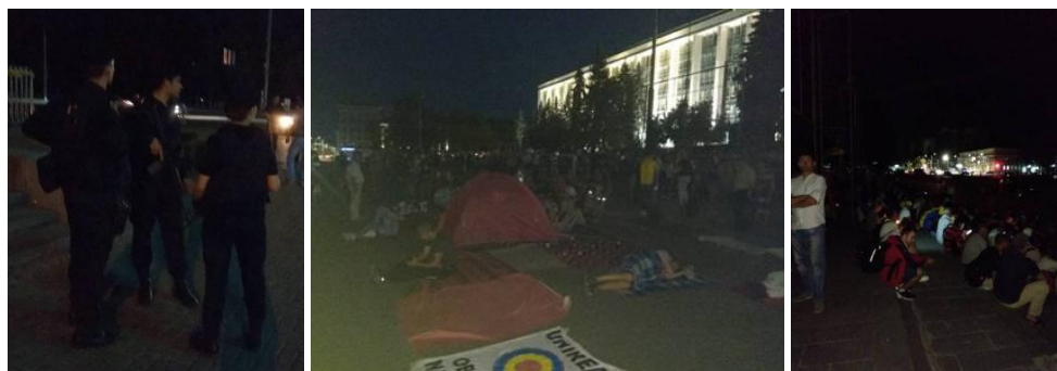
Polițiști BPDS Fulger cu arme M16 în PMAN după lăsarea întunericului (stînga). Participanții oboșiți s-au instalat pe jos în PMAN, așteptând soluționarea situației autocarelor; în plan îndepărtat apare clădirea Guvernului cu fațada iluminată (centru). Participanții așteptând în întuneric, așezați pe bordurile din PMAN; în plan îndepărtat, în contrast cu întunericul din PMAN ard luminile nocturne de pe str Bănulescu Bodoni (dreapta).