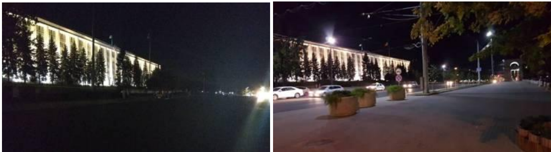
PMAN în întuneric în timpul întrunirii la aproximativ ora 21:00 (stînga) și iluminată imediat după întrunire la aproximativ 00:30 (dreapta)