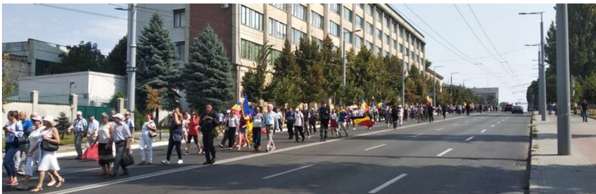
Participanții în marș pe bd. Ștefan cel Mare pe sensul de deplasare spre Calea Ieșilor după ce au fost informați că autocarele îi așteaptă la ieșirea din oraș.