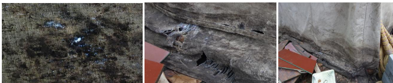
Acoperișul (stînga) și peretele lateral (centru și dreapta) ale cortului, care prezentau găuri erodate și destrămări, presupus a fi provocate de substanța cu care a fost stropit de persoane necunoscute.