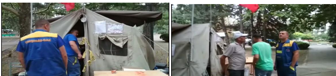
Angajații Chișinău-GAZ în procesul de inspectare a locului întrunirii pentru identificarea scurgerii de gaz 34