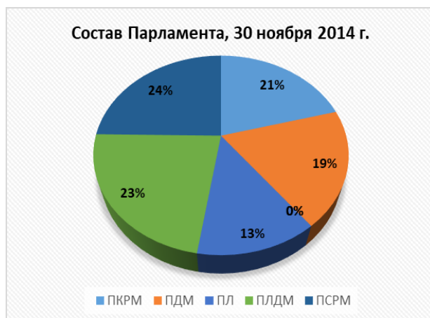
График № 1.