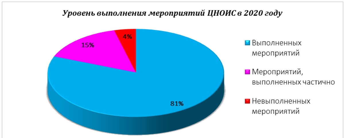
График № 5

По сравнению с 2019 годом, когда доля полностью выполненных мероприятий составляла всего 48% от запланированных мероприятий, мы видим, что в 2020 году ЦНОИС активизировал свои усилия для достижения задач, направленных на стратегические направления развития учреждения.