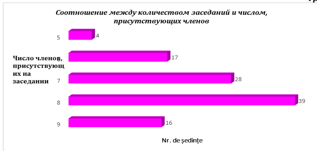
График № 3

Присутствие членов Комиссии в заседаниях обязательно. Таким образом, согласно этим 75 протоколам, размещенным на сайте ведомства, в 15 заседаниях приняли участие 9 членов ЦИК, в 26 заседаниях – 8 членов ЦИК, в 19 заседаниях – 7 членов ЦИК, в 11 заседаниях – 6 членов, а в 4 заседаниях приняли участие только 5 членов ЦИК (см. График № 3).