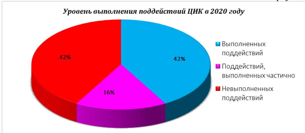
График № 4

По сравнению с 2019 годом, когда доля выполненных мероприятий составила 63% от запланированных действий, в 2020 году наблюдается снижение результатов, достигнутых избирательным органом для реализации целей, изложенных в Стратегическом плане ЦИК на 2020-2023 годы. Мы хотели бы отметить, что, согласно Отчету о деятельности учреждения, на реализацию 14 (21%) поддействий повлиял кризис пандемии COVID-19.